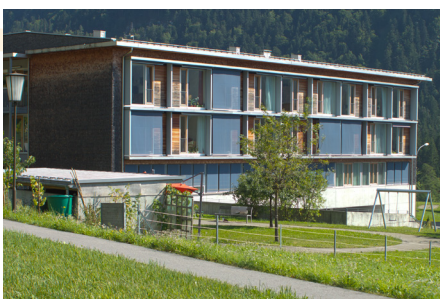
Sozialzentrum Haus Klostertal

Das Hittisauer Sozialzentrum feiert dieses Jahr das 20-jährige Bestehen, und zwar am Sonntag, den 21. Juni mit einem Fest-Gottesdienst und anschließendem Frühschoppen. Zudem gibt es für die Bevölkerung die Möglichkeit, das Pflegeheim, dessen Team und Leistungen bei einem Tag der offenen Tür kennen zu lernen.